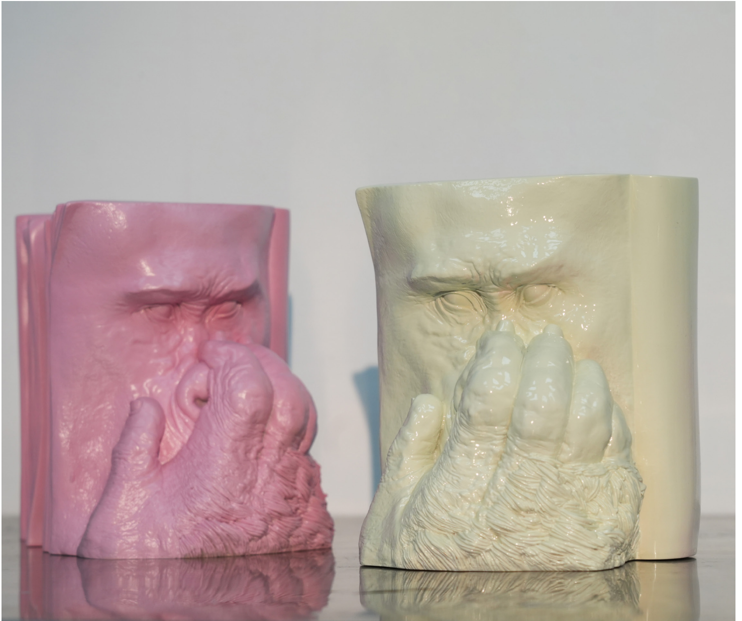
Theorem des endlos tippenden Affens 25 x 30 x 30 cm, Epoxidharz, Ölfarbe, 2025 handbemalt, variabel